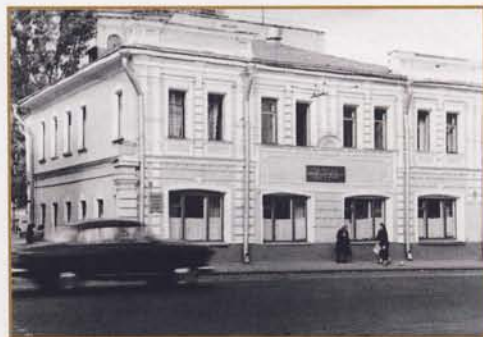
Старое здание школы — ул. Чернышевского 45

С Днем рождения, Школа, и доброго тебе пути к приближающемуся столетию.