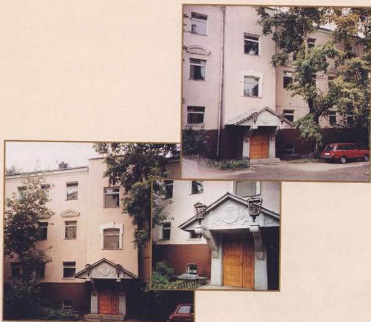
Новое здание школы. Покровка 39