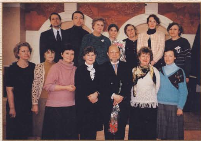
1997 г. На ф-ном отделе. Мастер-класс проф. Такаши Ямадзаки (Япония)